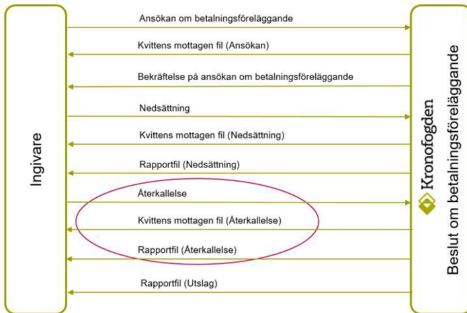
Figur 1 - Transaktionen Återkallelse i sitt sammanhang.

Transaktionsfilen för återkallelse innehåller transaktioner som innebär att sökanden återkallar ett ärende/mål om betalningsföreläggande. Samverkan mellan transaktionerna beskrivs ytterligare i dokumentet Funktionell beskrivning av tjänsten Beslut om betalningsföreläggande .